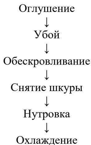
Рисунок 1.1 – Технологическая схема первичной переработки убойных животных

Технологическая схема первичной переработки убойных животных, выполненная с использованием символов, представлена на рисунке 1.1.