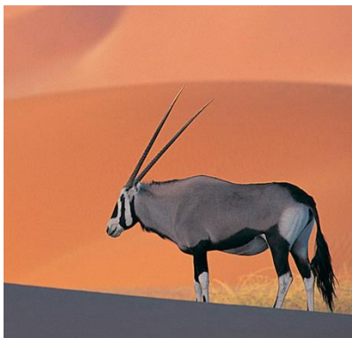
Рисунок 1.3 – Представитель крупного рогатого скота